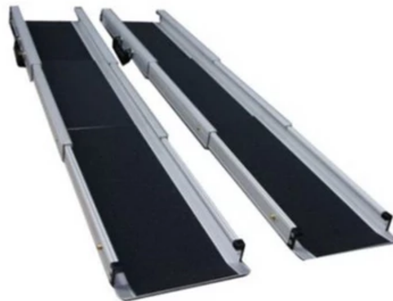
Rampa para Cadeira de Rodas 210 cm - García 1880

Problemas: Cara, e difícil de transportar