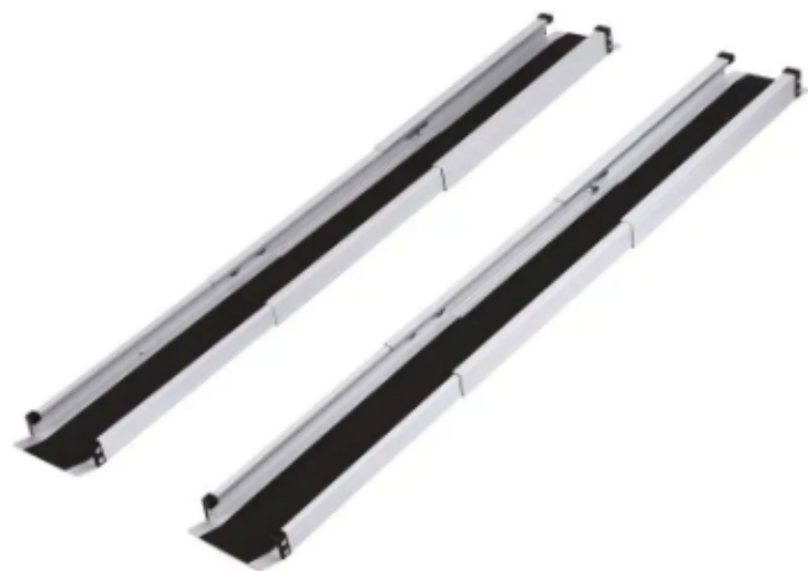
Rampas Telescópicas Longas - García 1880