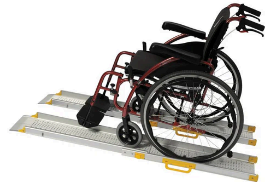
Par de Rampas Telescópicas - ERGO

Problemas: Difícil de transportar e cara